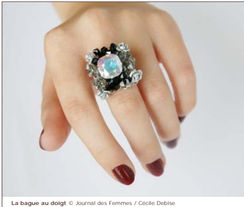
La bague au doigt