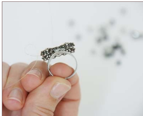
Introduire le fil de nylon