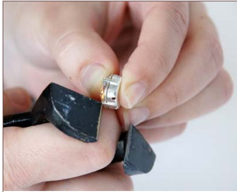
Poser le cabochon dans son serti