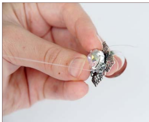
Enfiler les perles