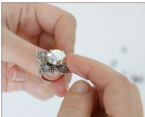
Fixer le serti sur l'estampe