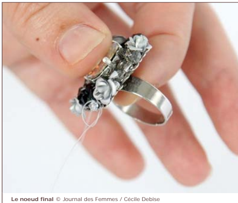
Le noeud final