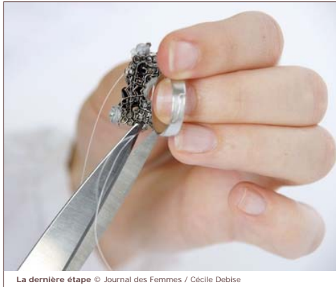
La dernière étape