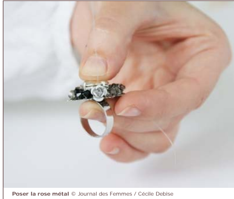
Poser la rose métal